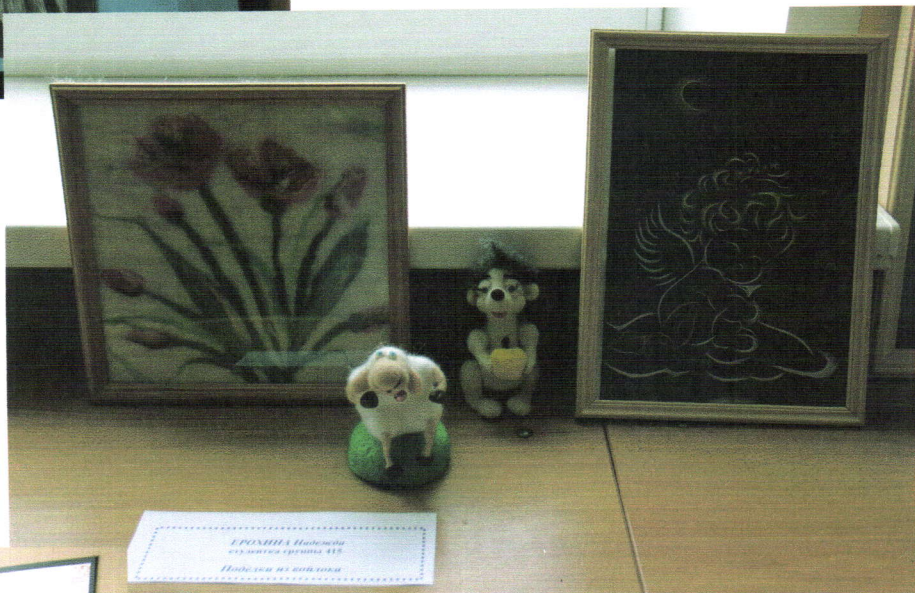
Ноу-хау выставки - изделия из войлока Ерохиной Нади